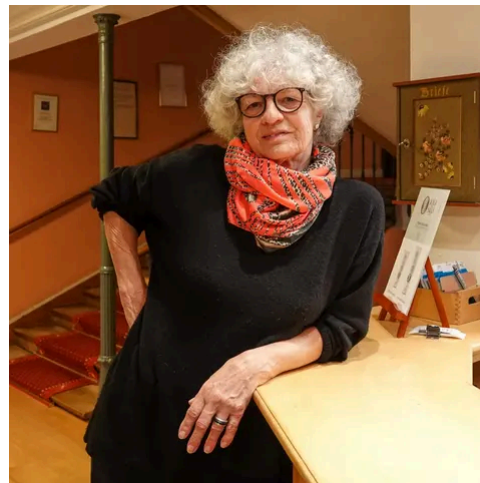
Ursula Koller gestaltet seit 1991 die Badener Fasnachtsplaketten

Die aktuelle Plakette wurde abermals von Ursula Koller gestaltet. Seit 1991 illustrierte die Badener Grafikerin und Illustratorin sämtliche Sujets der Badener Fasnacht. Auf eigenen Wunsch werde sie ihr jahrzehntelanges Engagement mit dem aktuellen Sujet beschliessen, teilt die Spanischbrödlizunft mit. Damit geht nach 33 Jahren eine Ära in Baden zu Ende.