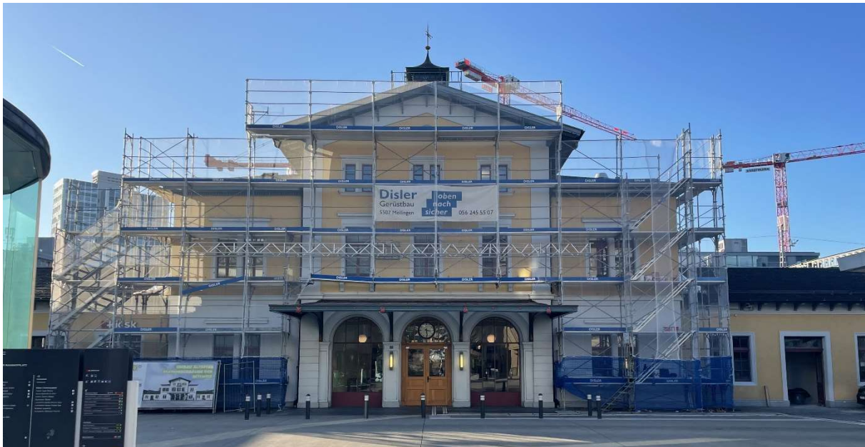
Bahnhofgebäude mit Fassadengerüst