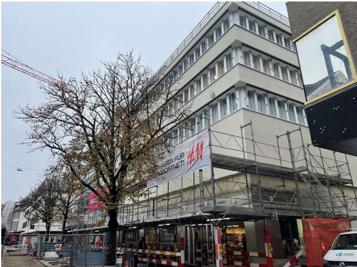
Gerüst zur Montage des Vordachs Badstrasse 17