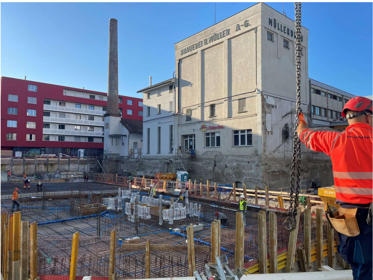
Fertiggestellte Bodenplatte Haus A