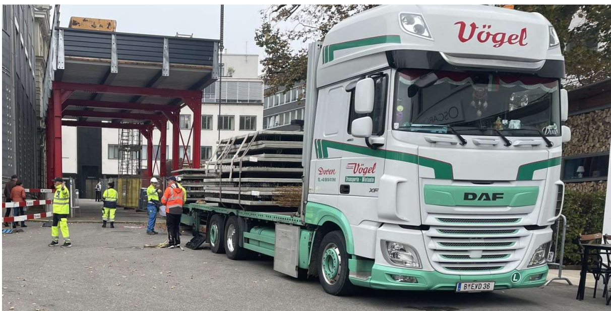
Spezialtransport mit Wandelementen Theaterplatz 12