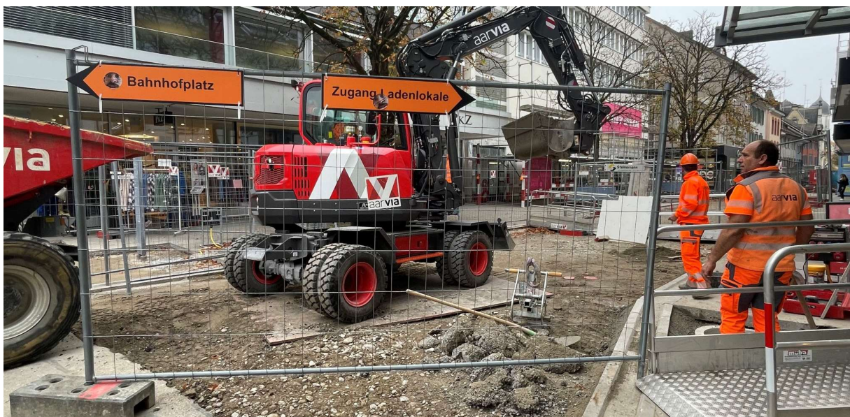
Letzte Setzungen der Schächte in der Badstrasse