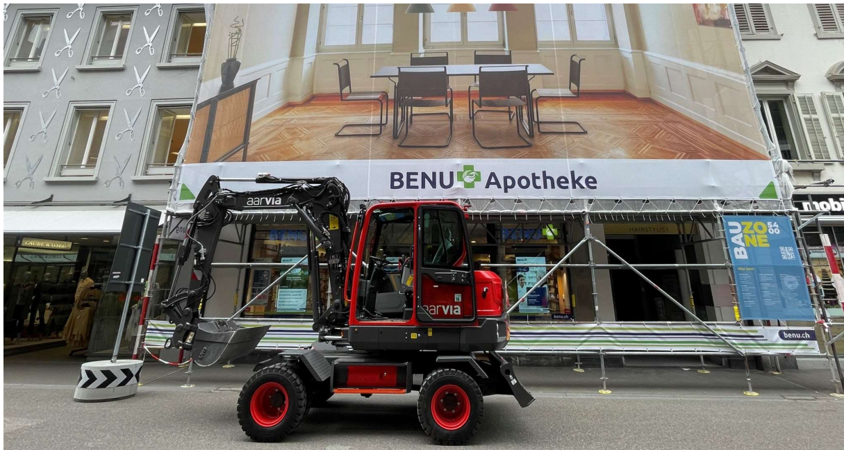
Fassadengerüst Badstrasse 5