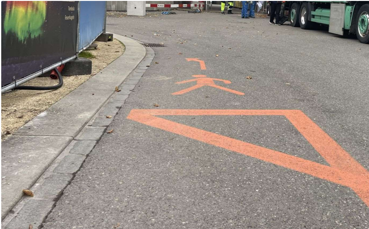
Fussgängerführung am Theaterplatz