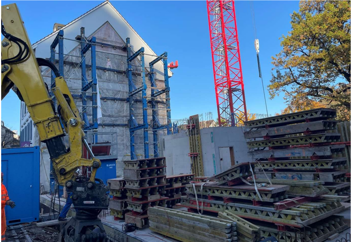
Erste Wände Badstrasse 14/16