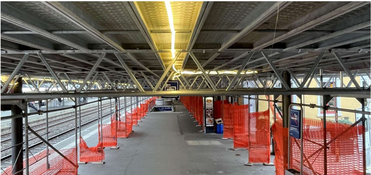
Schutz- und Arbeitsgerüst unter dem Perrondach