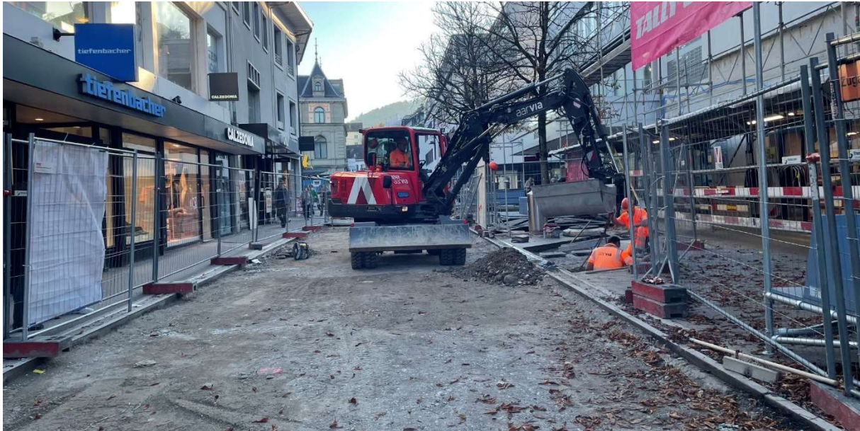
Vorbereitung der Planie in der Badstrasse